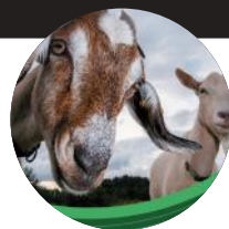
Premín® GOAT Müsli